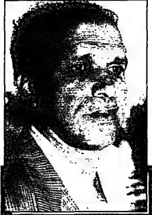
شخصية مسرحية مذكورة في قصة الفيلسوف المسافر (في الأسفل)